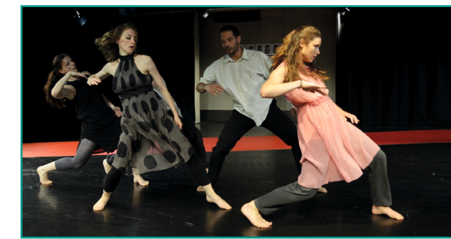
„Alle Zeit der Welt“

Aufgrund der begrenzten Platzkapazitäten bitten wir Sie, sich bis zum 15. April 2016 verbindlich anzumelden (s. Programmteil).