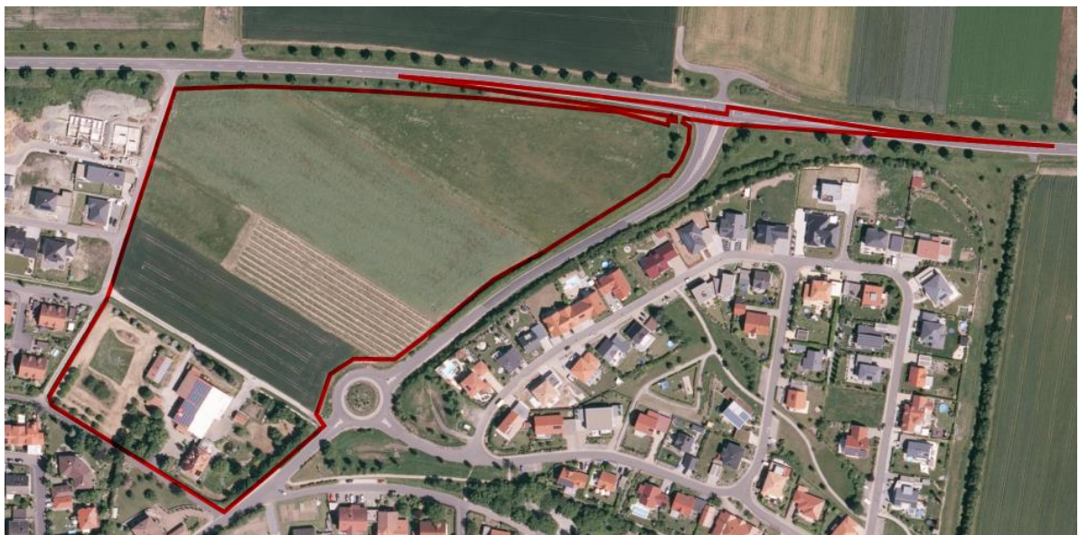
Abbildung 1: Übersichtslageplan mit Geltungsbereich des Bebauungsplanes "Schlossgrund" (rot)

Für eine detaillierte Darstellung des Inhalts und der wichtigsten Ziele des Bauleitplanes wird auf die Begründung des Bebauungsplanes "Schlossgrund" verwiesen.