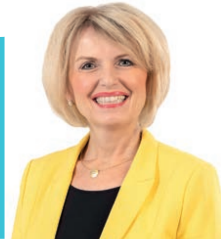
LANDRÄTIN TAMARA BISCHOF

IHR ZUVERLÄSSIGER LOTSE FÜR DIE MÜLLABFUHR